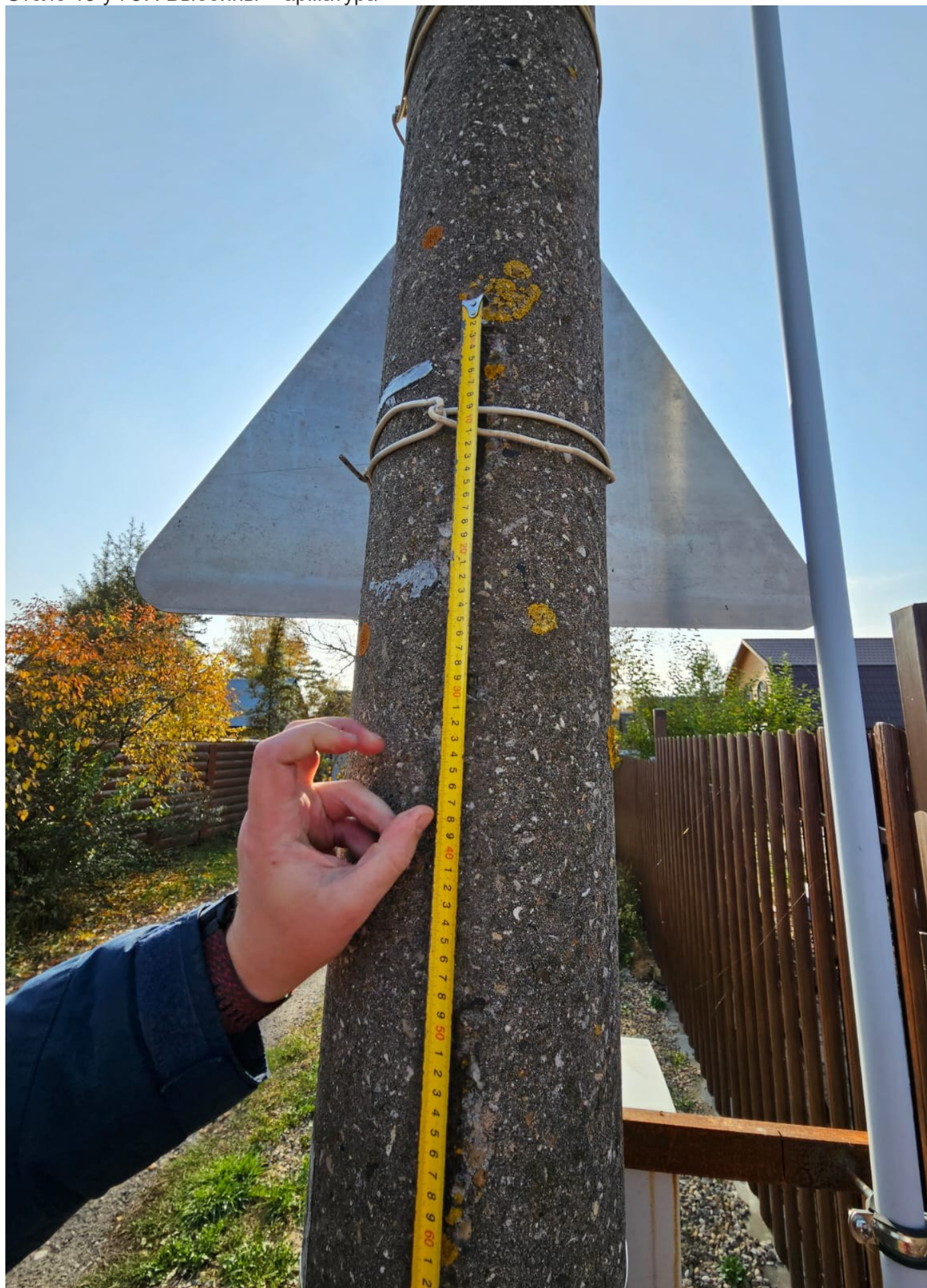
Столб 19 уч 57. Выбоины + арматура